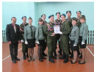
Военно-патриотический клуб «Комбат»

Муниципальное бюджетное образовательное учреждение средняя общеобразовательная школа №1 сельского поселения «Село Пивань» Комсомольского муниципального района Хабаровского края